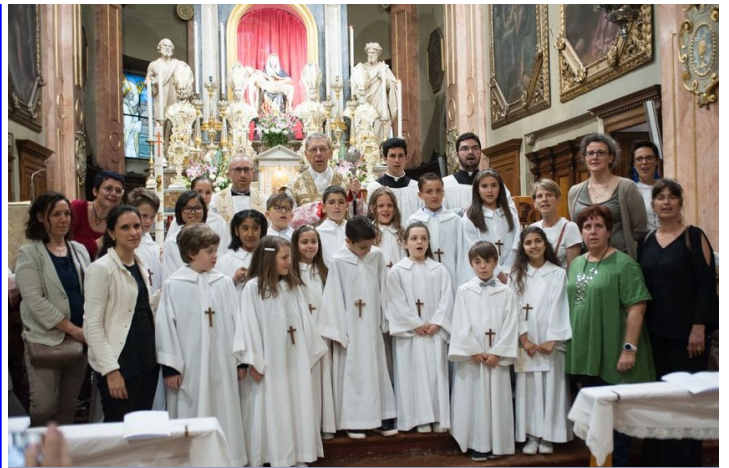
13 maggio 2018 h 16