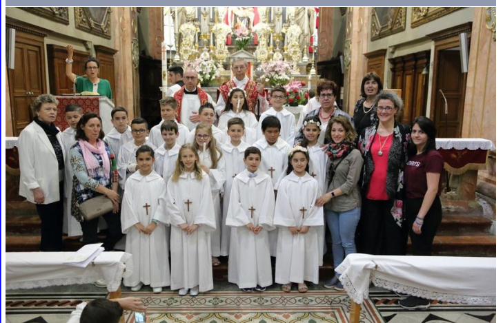
20 maggio 2018 h 16