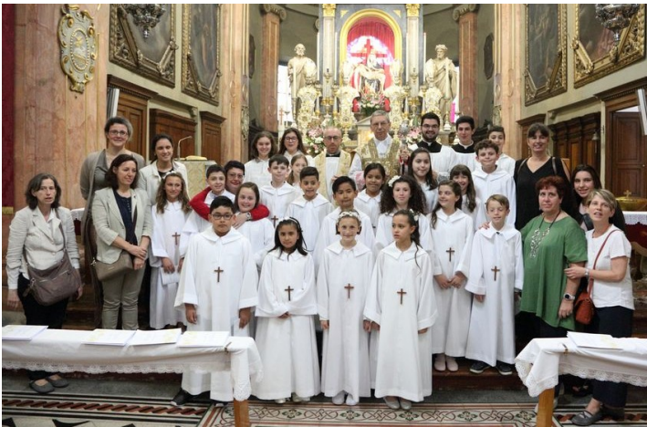
13 maggio 2018 h 12