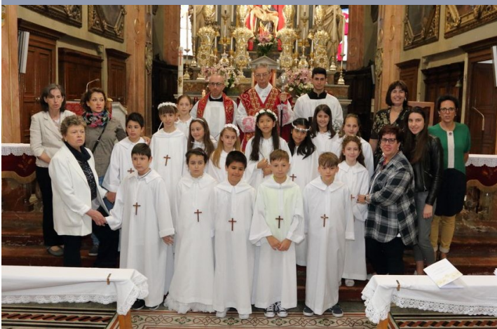
20 maggio 2018 h 12